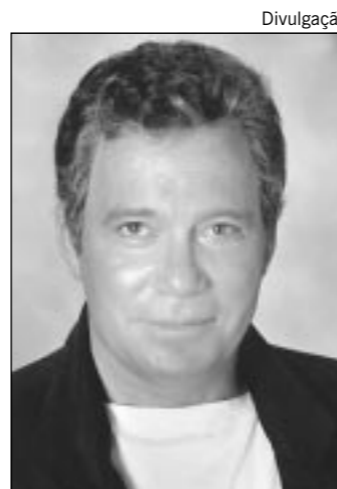
SHATNER: RICO graças à Internet

Numa espetacular reviravolta nos últimos pregões, os papéis de Shatner pularam de alguns mil dólares para quase US$ 300 milhões.