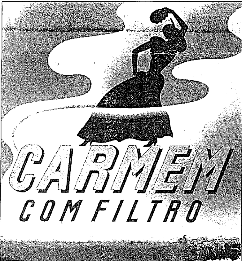
„Carmen com filtro“ - Plakat für Gerald Thomas' Mérimée-Adaption, die er Kafkas „Prozeß“ gegenüberstellt.

rungen, die ihn dennoch skeptisch gemacht haben.